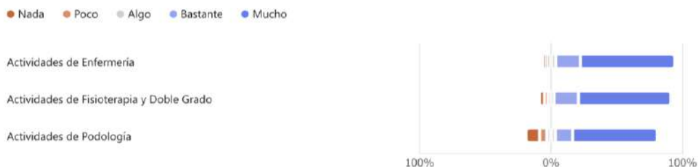
Imagen 4. Porcentaje de satisfacción de las respectivas acciones desarrolladas por las personas colaboradoras de la Facultad de Enfermería, Fisioterapia y Podología.

La clasificación promedio con respecto a la globalidad del stand ha sido de 9,55 puntos sobre 10, dando un valor de 10 en 75% de las personas visitantes, tal como se muestra en la gráfica inferior.