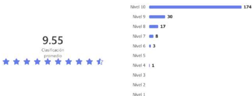
Imagen 5. Satisfacción global de la muestra con el stand de la Facultad.

La clasificación promedio con respecto a la globalidad del stand ha sido de 9,55 puntos sobre 10, dando un valor de 10 en 75% de las personas visitantes, tal como se muestra en la gráfica inferior.