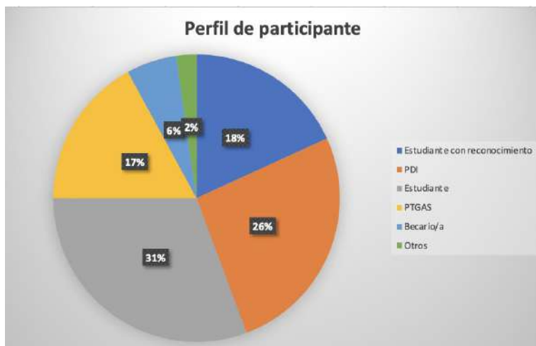
Gráfica 1. Distribución de las personas participantes por categorías.

A través de 25 actividades se pudo mostrar las respectivas disciplinas. La imagen inferior muestra algunas instantáneas de las acciones desarrolladas en el Stand de la Facultad.