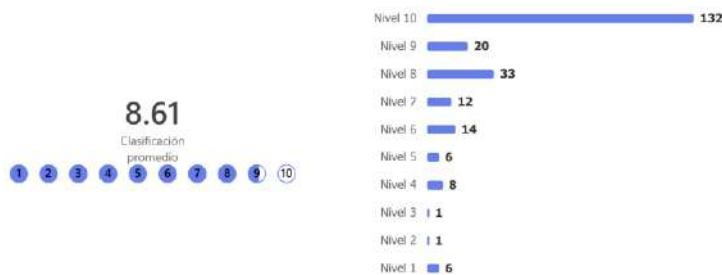
Imagen 7. Puntuación promedio sobre el interés por cursar alguna de nuestras titulaciones.

La última pregunta que se incluía dentro del cuestionario diseñado a través de la herramienta Microsoft Forms fue qué grado de interés tenían por cursar alguna de nuestras titulaciones. Tal como se observa en la gráfica inferior, el promedio obtenido es de 8,61 sobre 10. En este caso, se destaca que el 57% de la muestra aporta un valor de 10, el 9% un valor de 9 y el 14% un valor de 8. Tan solo el 6,86% tiene un interés inferior a 5 por nuestros títulos. Este hecho sustenta que nuestros grados siguen siendo demandados por la sociedad.