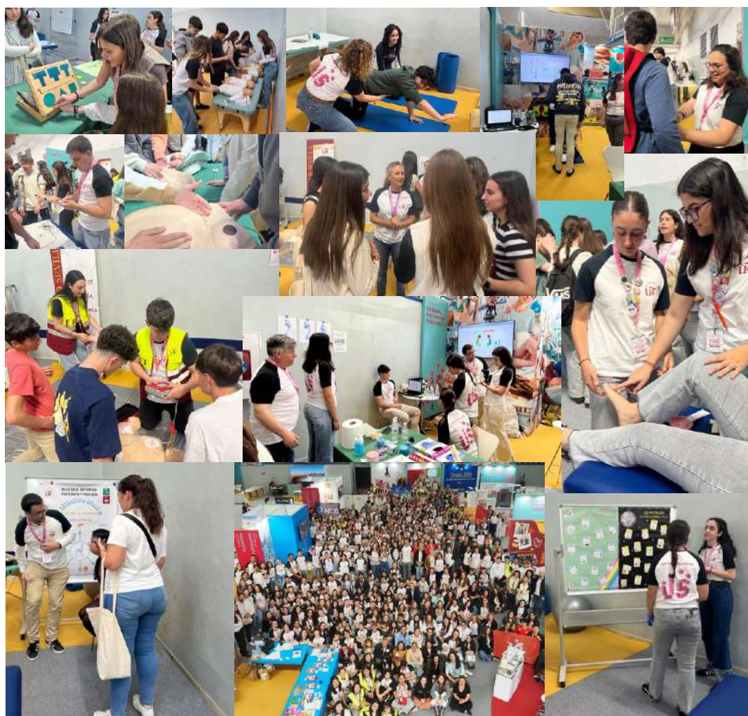
Imagen 2. Ejemplo de actividades desarrolladas. Fuente: Elaboración propia.

A través de 25 actividades se pudo mostrar las respectivas disciplinas. La imagen inferior muestra algunas instantáneas de las acciones desarrolladas en el Stand de la Facultad.